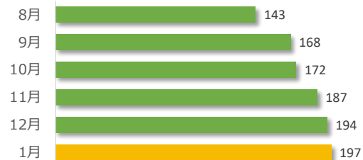
相談件数の推移（直近6か月）

1月の相談件数は197件で、相談者の内訳は医療機関が71件、遺族等が114件、その他・不明が12件でした。 (相談内容については別添参照) 遺族等の求めに応じて相談内容をセンターが医療機関へ伝達したものは3件（累計102件）でした。 医療機関から医療事故の判断について相談を受け、センター合議を開催し、医療機関へ助言したものは11件（累計295件）でした。