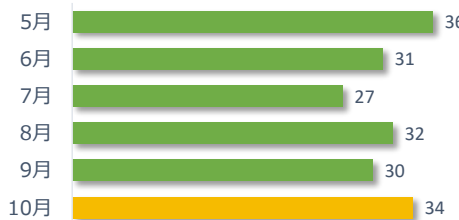
院内調査結果報告件数の推移（直近 6 か月）